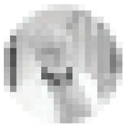
Deputy for Treatment. prevent. roast

Na některé kliniky si ovšem důvtipně smýšlející AI nepřijde! Kde nic není, není co pokazit, tedy, dovolte nám představit: