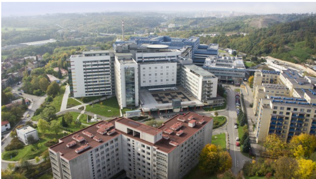
Dětská nemocnice a budova, v níž v současnosti sídlí ředitelství FNM a děkanát 2. lékařské fakulty.

Univerzitu Karlovu založil český a římský král Karel IV. listinou ze 7. dubna 1348 jako první z vysokých učení (studii generale) na sever od Alp a na východ od Paříže. Univerzita Karlova tak náleží k starým evropským univerzitám.