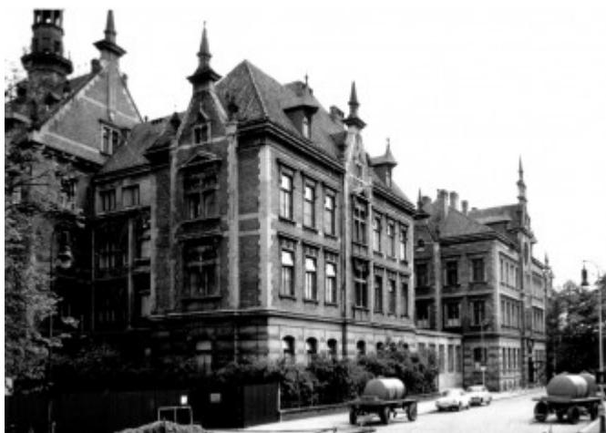
Lékařská (medicínská) fakulta byla součástí

Zdroj: Forum , speciální číslo k 670. výročí založení UK, 2018, s. 1.